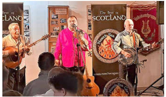
North Sea Gas

Ende März war die schottische Band „North Sea Gas“ im Dorfgemeinschaftshaus Muschwitz zu Gast und konnte neben bekannten Liedern, auch einiges Neues zum Besten geben. Bei toller Stimmung und lockerer Atmosphäre mit einem Glas Whisky, konnten sich die Gäste über „Kultur auf dem Dorf“ freuen.